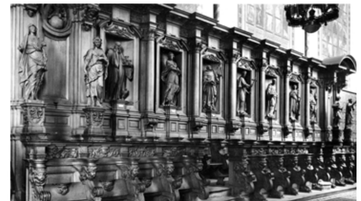
Het koorgestoelte in de vooroorlogse kerk. De beelden werden tijdens de bevrijding verborgen in een kuil met stro en bleven behouden. Het koorgestoelte zelf verbrandde tijdens de bevrijdingsacties.