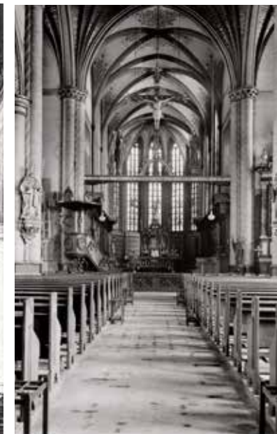
Het interieur van de Lambertuskerk voor de Tweede Wereldoorlog. Met in het priesterkoor de koorbanken met de beelden. De bidstoelen waren toen al vervangen door banken.