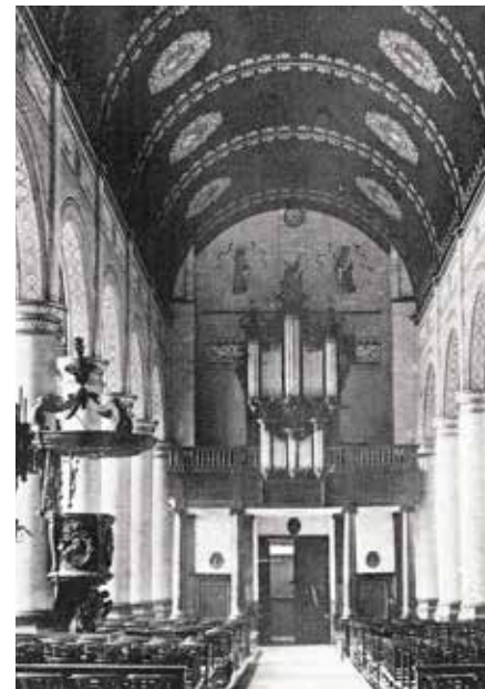
Het interieur van de Lambertuskerk gezien richting de toren. Onder de toren stond het orgel en was de koorzolder. Hier is duidelijk het tongewelf te zien dat door Pierre Cuypers in de kerk was aangebracht.