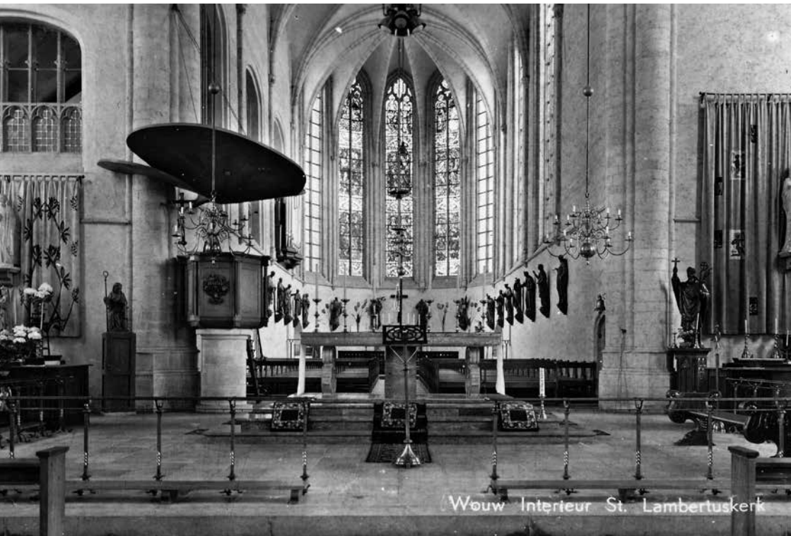
Na de herbouw van de kerk, zag het interieur er heel anders uit. De koorbanken waren verdwenen, maar de beelden kregen een prominente plaats in het priesterkoor. Hier zijn nog de preekstoel, de communiebanken en de beide zijaltaren te zien