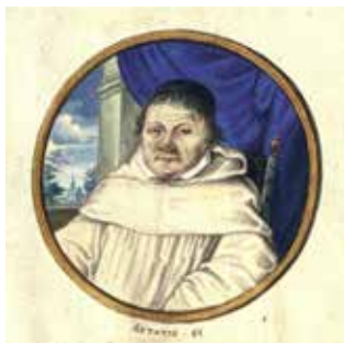
Judocus Bal was een tijdlang pastoor in Wouw, hij werd vooral bekend door het 'Landboek der abdij van Sinte Bernards'. In deel twee is dit miniatuur van hem afgebeeld.

In het jaar 1295 was sprake van het huis van de pastoor, dat ten westen van de kerk stond op de plaats waar later het huis en de werkplaats van de plaatselijke smid stonden (nu Markt 2). In het begin van de dertiende eeuw werd het gebouw nog enkele keren genoemd en daaruit blijkt dat de kerk op de plaats stond waar hij nu nog staat.