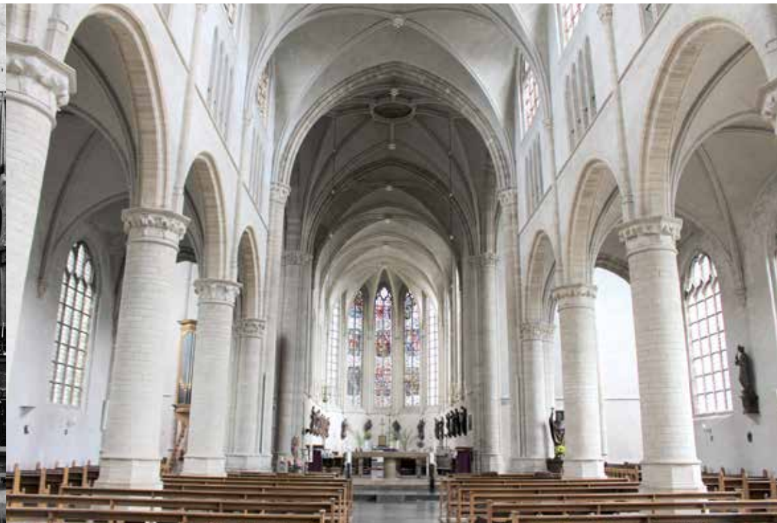
Het interieur van de Lambertuskerk in 2020. Tussen de pilaren rechts is nog een deel van het nieuwe orgel te zien.