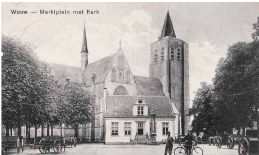
De Lambertuskerk rond 1917. Het ranke vieringtorentje en het doorlopende dak op het middenschip zijn de kenmerken van de vooroorlogse kerk

Vanaf dat moment werden er jarenlang herstelwerkzaamheden aan de kerk uitgevoerd. In 1827 kreeg het kerkinterieur een schitterende aanvulling in de vorm van het koorgestoelte van de abdijkerk van Sint Bernards te Hemiksem. Dat had de abdijs in 1797 teruggekocht van de Fransen en opgeslagen in Antwerpen en later in een schuur in Oud Gastel. Na wat aanpassingen werd het koorgestoelte met de houten beelden in het koor van de Wouwse kerk geplaatst.