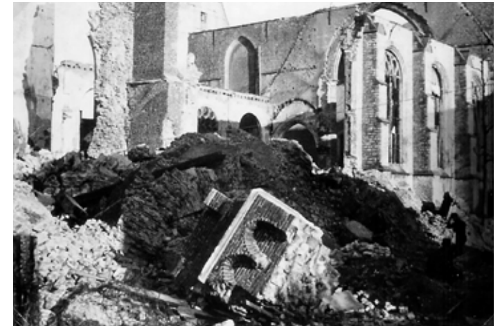
Toen de toren op 27 oktober 1944 werd opgeblazen viel het puin deels op het middenschip en richtte een ravage aan. Na de brisantgranaten op 29 oktober bleef er van het complete gebouw weinig over.