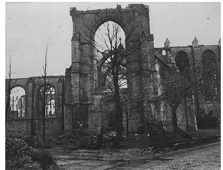
De restanten van de kerk gezien vanuit de Bergestraat. Rechts staan de muren van het priesterkoor nog overeind, maar het dak is verbrand net als de koorbanken die in het priesterkoor stonden (Collectie Kerkbestuur Wouw)