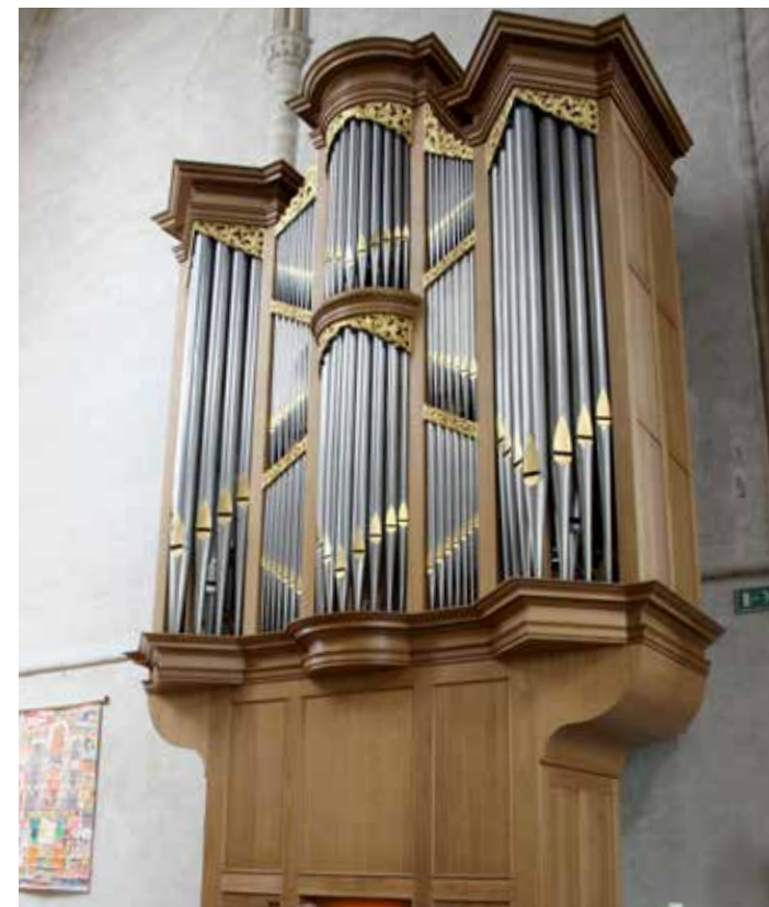
Het Verschuierenorgel in de Lambertuskerk betekende destijds een aanwinst. Regelmatig worden er ook nu nog orgelconcerten verzorgd door de Stichting Orgelfonds Wouw.

Begin 1984 werd het nieuwe orgel, met als werknummer 'Opus 1000', geplaatst en op 6 mei van dat jaar vond de inauguratie plaats. Vanaf dat moment zorgt het Orgelfonds regelmatig voor concerten in de Lambertuskerk.