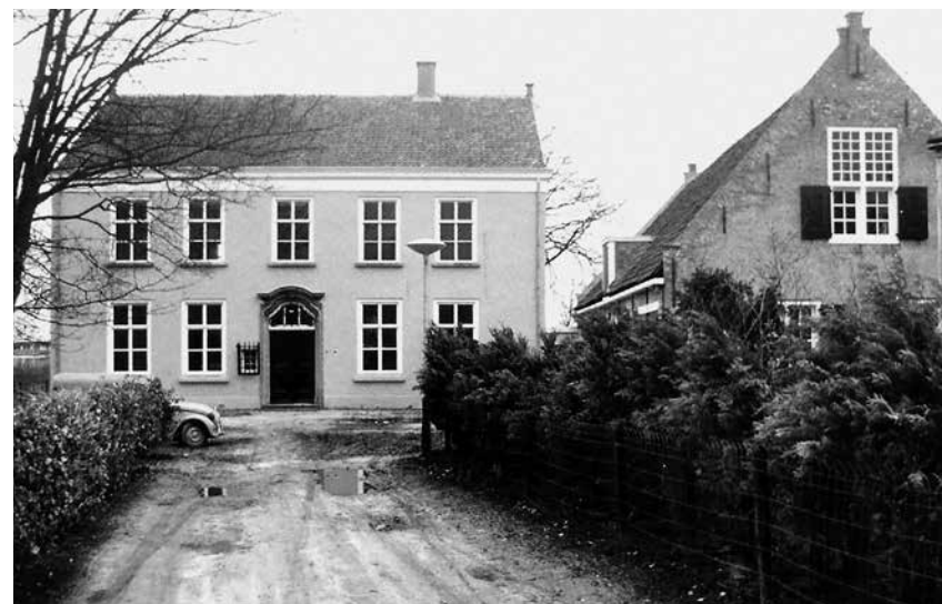
De 'oude pastorie' in de Bergsestraat werd in 1660 gebouwd en was later in gebruik als Wit-Gele kruisgebouw, woning voor enkele gezinnen, ambtswoning van de burgemeester en woonhuis.