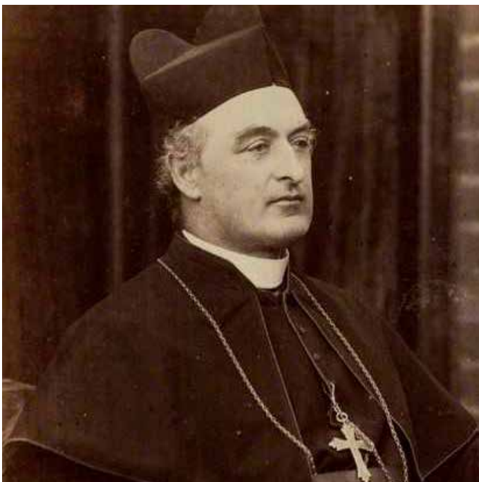
Herbert Vaughan.

Vaughan was ervan overtuigd dat hij in Nederland meer studenten voor Mill Hill kon werven, afgaande op het grote aantal Nederlandse jongens dat als zouaaf vocht. Zouaven waren katholieke mannen die zich tussen 1861 en 1870 aansloten bij het pauselijke leger voor de verdediging van de Kerkelijke Staat tijdens de Italiaanse eenwording. Het aandeel Nederlandse zouaven in het leger van de paus was relatief groot. Waar beter dan bij die religieus gemotiveerde Nederlanders kon Vaughan zijn missionarissen gaan zoeken? Hij vertrok in 1871 naar Nederland voor zijn wervingscampagne. Die was in zijn ogen geen groot succes. In een brief aan een Engelse bekeerlinge schrijft hij dat 'hij wel een paar keer beet heeft gehad, maar tot dusverre nog niet echt vis heeft gevangen'. Toch waren drie jaar later acht van de dertig studenten van Mill Hill Nederlands en leek de wervingscampagne een succes.