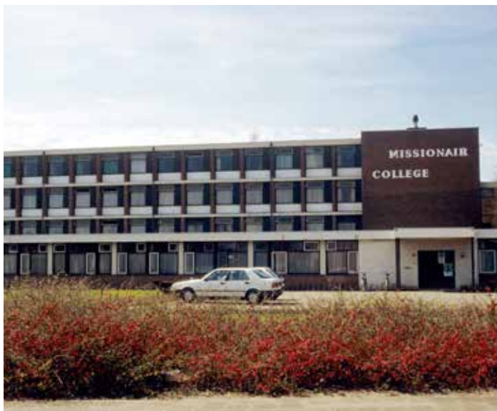
Missionair college Mill Hill aan de Boerhaavelaan in 1992

Het werk van de missionarissen over zee veranderde ook flink. Velen van hen namen dienst in het leger als aalmoezenier, vochten zelf mee of werden geïnterneerd. Het 'missievuur' leek bij de katholieke gelovigen alleen maar te groeien. Er wordt dan ook gesproken van 'het grote missie-uur' tussen 1915 en 1940, waarin de missie een bloeiperiode beleefde. Ook in het Roosendaalse college was dat merkbaar. Tijdens de oorlog groeide het aantal leerlingen tot 120 en in 1923 piekte het aantal tot 176. Vanaf 1914 verzezen er nieuwe Mill Hill-vestigingen in Tilburg, Hoorn en Haalen.