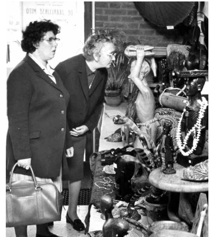
Bezoeksters MITO (missietoonstelling) in Missionair College Mill Hill aan de Boerhaavelaan in 1972

Voor veel Roosendalers is Mill Hill in de naoorlogse periode vooral bekend door de MITO, de Missietoonstelling. Vanaf 1947 werd de MITO jaarlijks georganiseerd door de missionarissen, de zusters van het nabijgelegen Elisabeth-klooster en de zogenaamde zelatrices: vrouwen die actief waren in rooms-katholieke organisaties. Tijdens de MITO werden objecten uit de missielanden zoals beelden en sieraden tentoongesteld en verkocht, konden kinderen spelletjes doen, was er een rad van fortuin en werd er religieuze waar zoals bijbeltjes verkocht. Daarnaast werd de MITO-mars gehouden, een wandeltocht voor de missie, en werd er jaarlijks een voetbalwedstrijd op touw gezet. De opbrengst van deze 'R.O.M.A. initiatieven' (Roosendaalse Missie Actie) ging uiteraard naar de missie. Scholieren werden aangemoedigd om ook bij te dragen aan de missie, bijvoorbeeld door het ophalen van recyclebaar zilverpapier en collectes met speciale 'missie-spaarpotjes'.