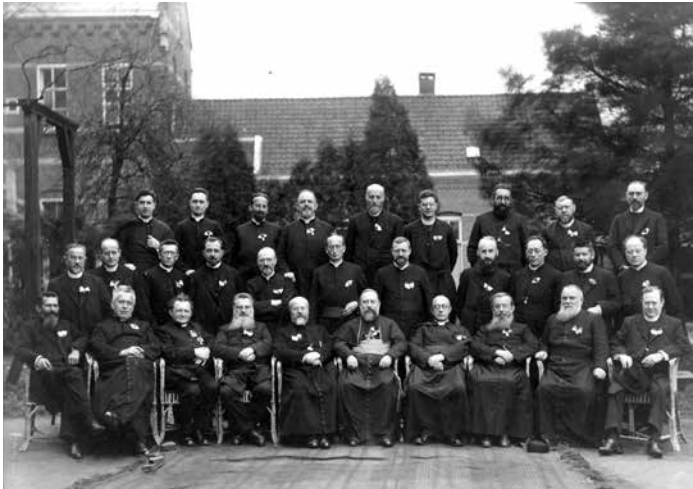
Docenten en leerlingen van Mill Hill in 1927.

Vóór de Eerste Wereldoorlog vertrokken er al 189 missionarissen die hun opleiding hadden gevolgd in Roosendaal de wereld in. Dit waren voornamelijk Nederlanders, al kwamen er vanaf 1895 ook Britten naar Roosendaal. Het idee was dat elke student een tijd in Roosendaal zou doorbrengen, al is dat nooit helemaal van de grond gekomen. De missie werd niet geleid vanuit Roosendaal maar vanuit één centraal punt. De Nederlandse missionarissen werden uitgezonden naar onder andere India, Pakistan, Oeganda, Belgisch-Congo, Maleisië, Nieuw-Zeeland, Kenia, Filipijnen, Kameroen en Soedan. Mill Hill verzorgde ook missiewerk op de Falklandeilanden en in Rwanda, maar het is niet bekend of daar ook Nederlandse missionarissen aan het werk waren. Ten slotte is er één Nederlandse Mill Hill-missionaris bekend die onder de Afro-Amerikaanse bevolking in Virginia (VS) ging werken.