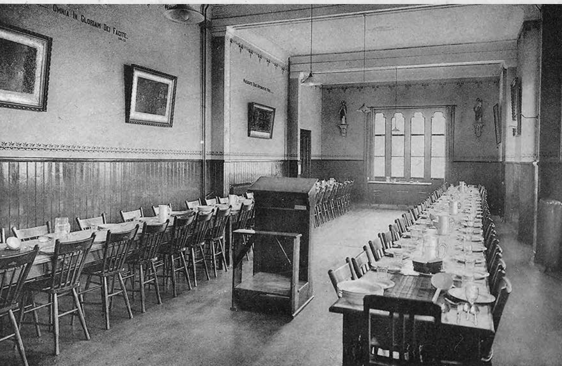
St. Joseph's Missiehuis, Roosendaal. N. B. Eetzaal.