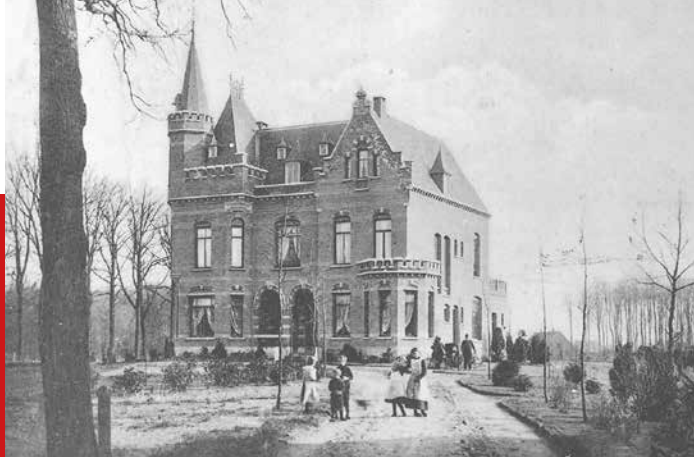
Mariahove in 1900 op een prentbriefkaart van uitgeverij Helvert-Weijermans