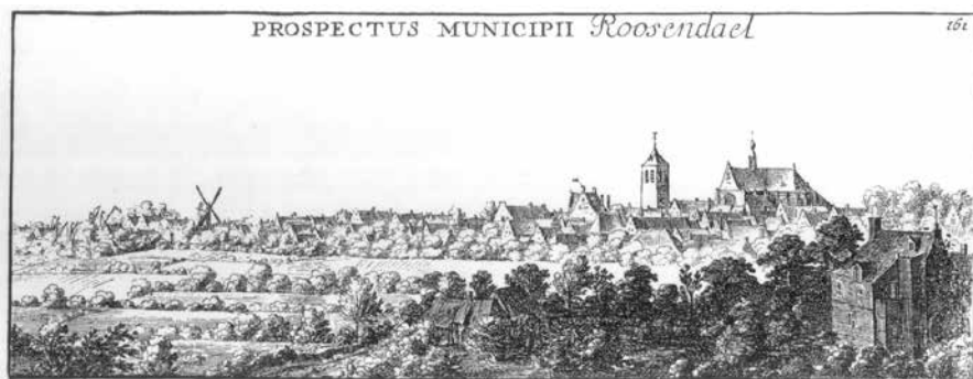
Gravure van Roosendaal met rechts het Vrouwenhof uit circa 1655, gemaakt door Abraham Dirkszoon Santvoort