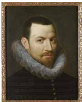
Portret van Nicolaas Rockox uit 1600, geschilderd door Otto van Veen