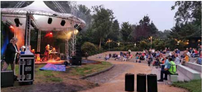
Het vernieuwde openluchttheater in gebruik in zomer 2021

Het Vrouwenhof heeft nog steeds de functie van openbaar park. Je kunt er een stukje wandelen, relaxen in het gras, je uitleven op de skatebaan, spelen in de speeltuin, een hapje eten in de historische villa of kijken bij het dierenkampje. Daarnaast is deze zomer het openluchttheater volledig vernieuwd waar je een concert of theatervoorstelling kunt bezoeken.