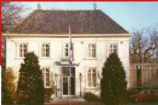
Villa Vrouwenhof in 1978