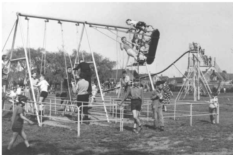
Speeltuin Vrouwenhof in 1968