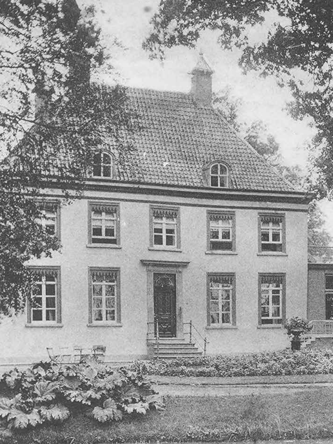
HUIZE „VROUWENHOF“, ROOSENDAAL