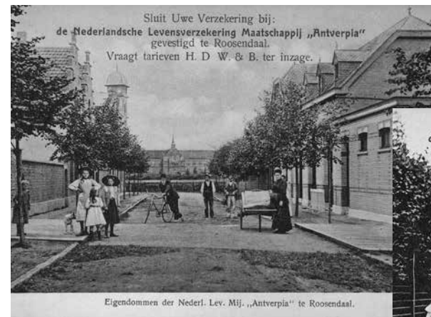
Links Boulevard Antverpia gezien in oostelijke richting, 1910