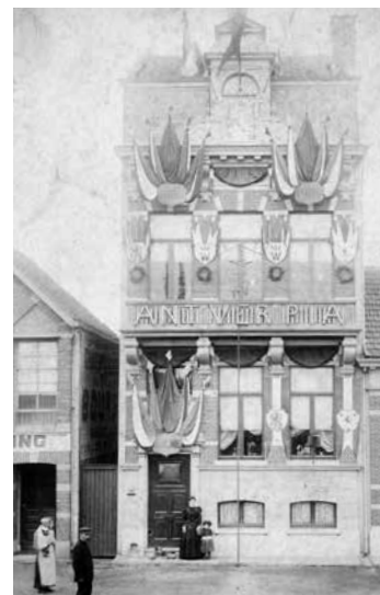
Links Hoofdkantoor Antverpia, 1898 Rechts Reclameplaat, c. 1900