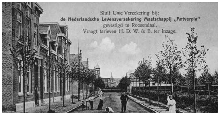
Boulevard Antverpia gezien in oostelijke richting, 1910

De bevolking van Roosendaal groeide mede door deze bedrijvigheid. In de halve eeuw tussen de komst van de spoorwegen en de Eerste Wereldoorlog verdriedubbelde het aantal inwoners tot 15.000. Van ruimtelijke ordening was nauwelijks sprake en het initiatief tot het voorzien in woonruimte en de aanleg van straten werd overgelaten aan particulieren en bedrijven. Op dit terrein zou zich ook de verzekeringsmaatschappij Antverpia begeven.