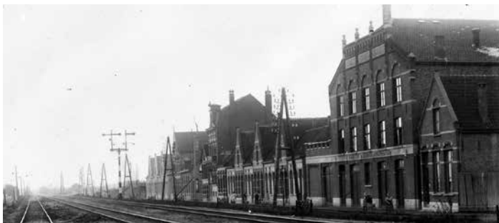
Badhuisstraat, c. 1900

De portefeuille verzekeringen moest worden overgedragen aan de levensverzekeringsbank 'Amsterdam' onder garantie van de levensverzekeringsmaatschappij Utrecht. Uiteindelijk kwam Antverpia in handen van de 'Utrecht', de maatschappij waar Van den Weijngaert eerder was vertrokken. In België en Frankrijk bleef de maatschappij bestaan nadat orde op zaken was gesteld. Oprichter Van den Weijngaert overleed in 1925. Na verschillende fusies en overnames is nu als opvolger van de Nederlandse maatschappij te beschouwen de firma a.s.r. verzekeringen gevestigd in Utrecht.