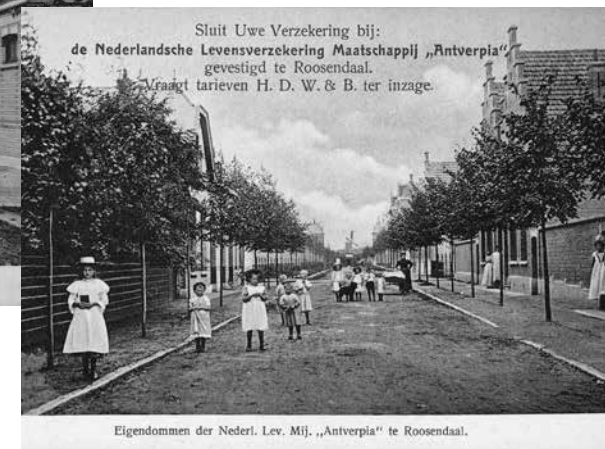
Eigendommen der Nederl. Lev. Mij. „Antverpia“ te Roosendaal.