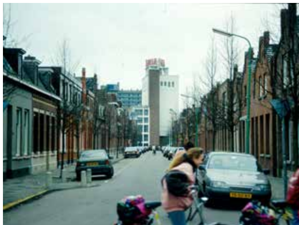
Links Boulevard Antverpia gezien in oostelijke richting, 2007 Rechts Boulevard Antverpia gezien in oostelijke richting, 1992

Behalve de bouw van huizen trof de maatschappij ook andere voorzieningen, zoals de aanleg van verharding en verlichting of de bouw van een brug over de Watermolenbeek (1904). Dat was ook wel nodig. Dagblad De Grondwet sprak vanwege de slechte toestand van de verharding in de Badhuisstraat zelfs van het 'Rotstraatje'. Net als in Sint-Mariaburg ging Antverpia over tot de exploitatie van een zwembad. Op 10 maart 1903 nam Antverpia een huis met tuin en zweminrichting over aan de Badhuisstraat, bestaande uit een houten gebouw met cabines. In 1905 volgde voor 15.600 gulden de bouw van een nieuw badhuis, dat bestond uit een woning voor de badmeester en vijf afzonderlijke badkamers.