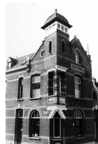
Links Boulevard Antverpia 2-2A, 1980 (foto J. van Rijen, collectie West-Brabants Archief) Rechts Boulevard Antverpia 4-6, 1980 (foto J. van Rijen, collectie West-Brabants Archief)