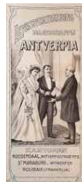
Links Situatieplan van over te dragen gronden van Antverpia, 1924 Rechts Polis van Antverpia, c. 1900