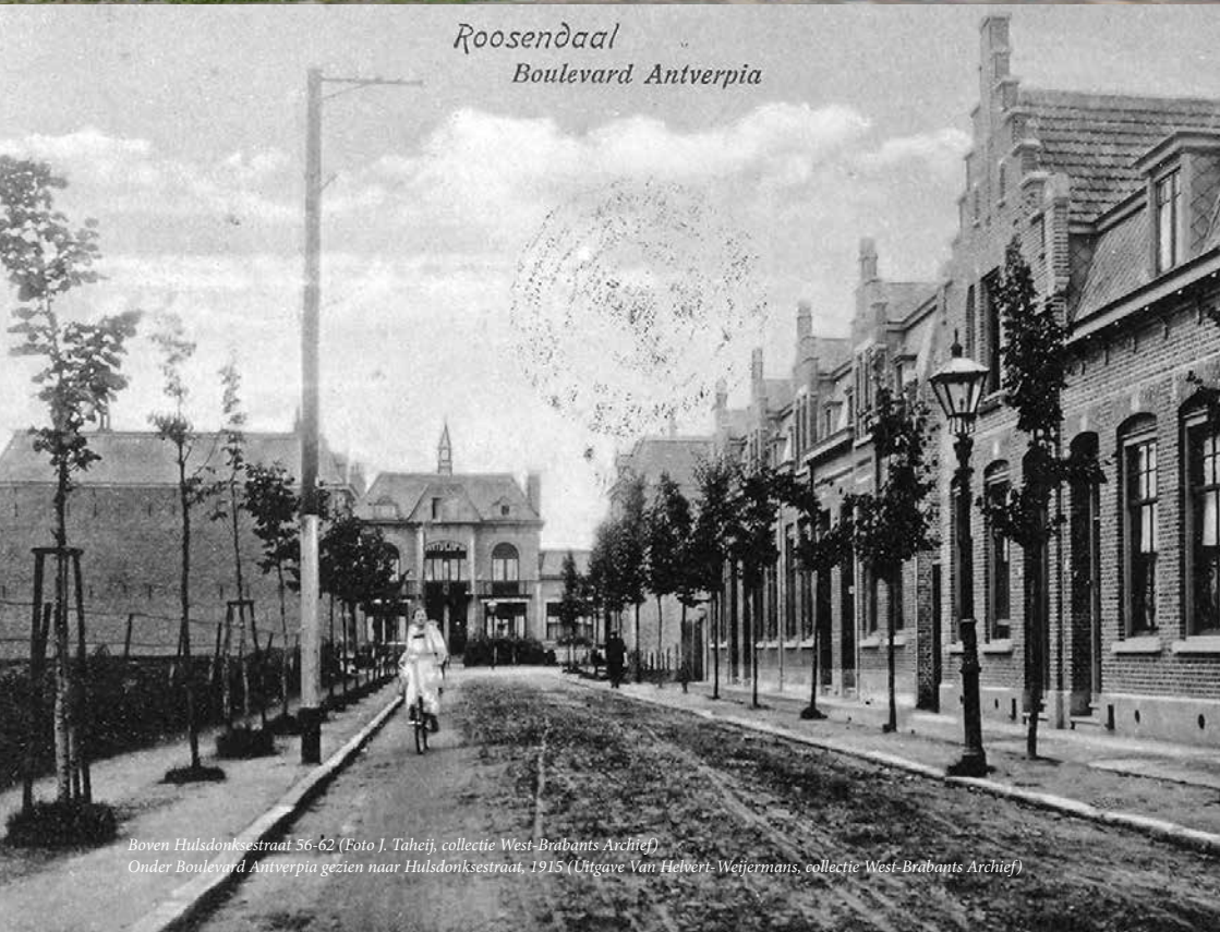
Boven Hulsdonksestraat 56-62 Onder Boulevard Antverpia gezien naar Hulsdonksestraat, 1915