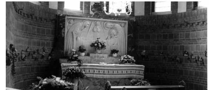
Devotialtaar Sint Joseph, 1999 (foto A. Mol)

J.E. Brom ontwierp zowel de godslamp van gebronsd koper in de apsis als de lamp die centraal in de koepel hangt. Beide zijn vervaardigd door de firma P.G. Duchateau.