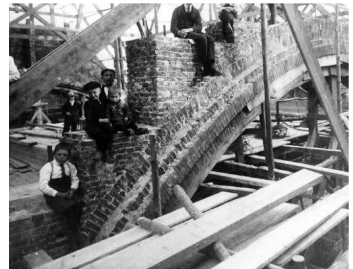
Bouw hoofdingang, 1924