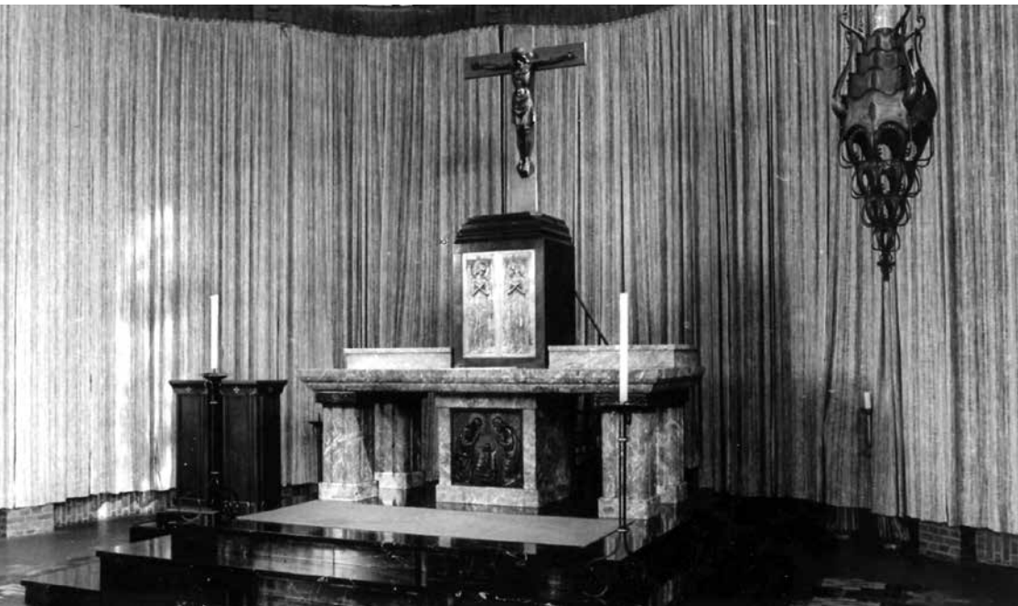
Hoofdaltaar, 1999

De muren van de kerk zijn gemetseld in genuanceerde gele baksteen. Typerend voor de Amsterdamse School is het siermetselwerk in de kerk. Mogelijk onder Amerikaanse invloed werkte Hurks in deze kerk niet met kleurschakeringen. De wijdingskruisjes in de muur zijn fraaie details. Op de oranje-gele tegeltjes staat een groen kruis met bruine doornenkroon. De hoeken zijn aangezet met een zwarte rand, typerend voor de Nederlandse Jugendstil.