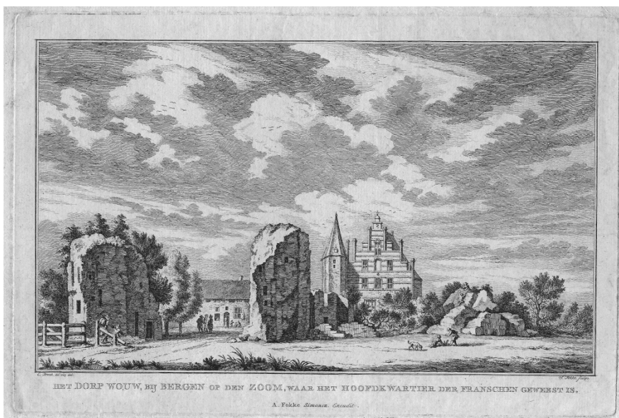
Ruïne rond 1747 getekend door Fokke