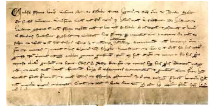
Akte van 5 november 1268, waarin de heer van Breda zijn goedkeuring geeft aan een schenking aan de kapel te Roosendaal. Dit is de eerst bekende vermelding van de naam Roosendaal: 'in loco dicto Rosendale' (collectie WBA, Gemeentearchief Roosendaal).