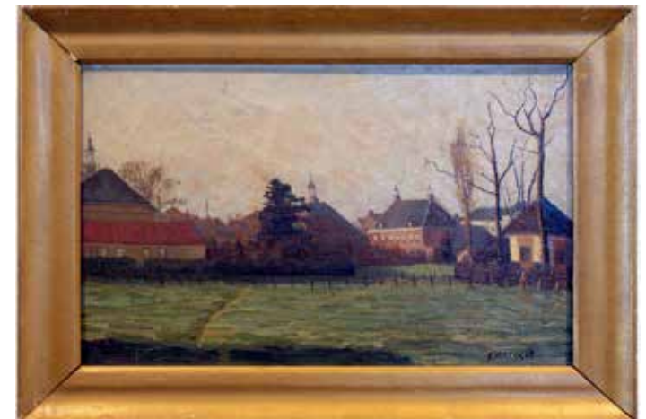
Schilderij van Fr. Hertoghs uit 1920 met rechts het Tongerlohuys (collectie WBA, Gemeentearchief Roosendaal).

De gracht die om het pand lag is tegenwoordig alleen nog terug te zien aan de voorkant en de zijkant van het Tongerlohuys, in vroegere tijden sloot deze zelfs aan op een aantal sloten en vaarten van het Roosendaalse afwateringssysteem.