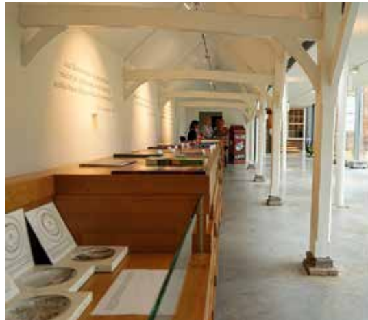
De corridor van het Tongerlohuys.