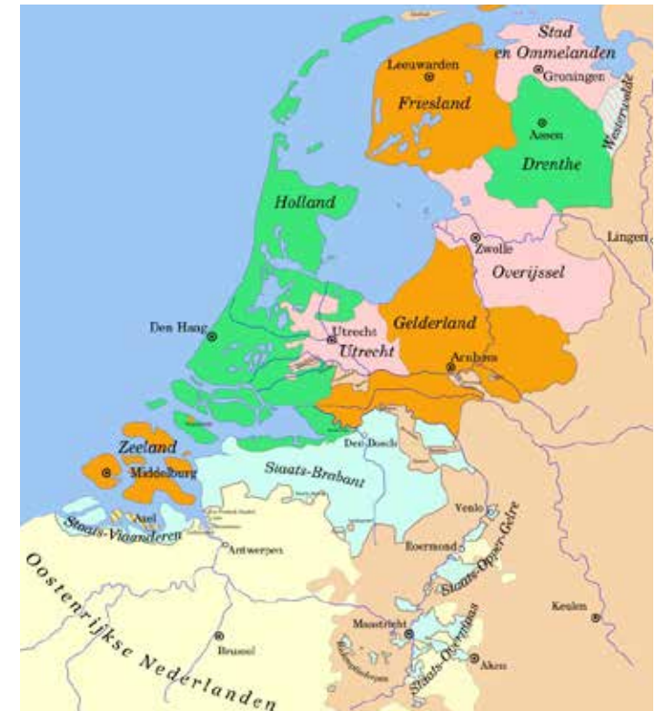
Republiek van de Republiek van de Zeven Verenigde Nederlanden met Staats-Brabant in het lichtblauw (Wikimedia Commons, kaart door Joostik).

Noirot stuurde de drossaard van de Baronie van Breda naar Roosendaal en deze gaf de schout de opdracht naar de pastorie te gaan met de boodschap dat hij deze wilde bekijken, ook van binnen. Hij kreeg echter van een meid door het raam antwoord dat ze niet open zou doen. Het verzoek werd enkele keren herhaald maar de deur bleef gesloten. Ondertussen verzamelden flink wat Roosendalers zich rond de pastorie. In enkele verontwaardigde brieven van Noirot aan de domeinraad is terug te lezen dat de meubels uit de pastorie gehaald werden maar de mensen bleven zitten, later zouden deze alsnog vertrekken maar bleven de deuren op slot en waren te sleutels niet te vinden. Uiteindelijk legden de schout, schepenen, rentmeester en een dienaar een plank over de gracht rondom het gebouw