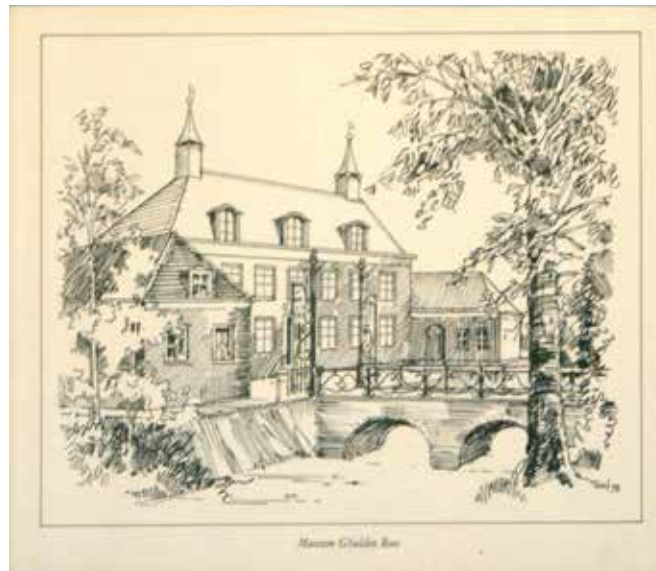
Gedrukte versie van een tekening van René van Hasselt van het Tongerlohuys in 1974 (Collectie WBA, Gemeentearchief Roosendaal).

De depotruimte werd gebruikt voor de collectie van Oudheidkundige Kring De Ghulden Roos. Deze werd in 1932 opgericht om voorwerpen, documenten en publicaties over de geschiedenis van Roosendaal te verzamelen. De collectie was van 1936 tot 1974 gehuisvest in het oude Raadhuis op de Markt. Onder andere dankzij de inzet van René van Hasselt (1909-1987) werd de collectie kunsthistorische voorwerpen flink uitgebreid, met een prachtige collectie maar ook ruimtegebrek tot gevolg. Gelukkig kon de collectie verhuizen naar het Tongerlohuys. De Ghulden Roos bestaat nog steeds en blijft actief in het uitbreiden van hun collectie die door het museum wordt beheerd. Daarnaast brengt de Ghulden Roos elk najaar een jaarboek uit vol publicaties over de geschiedenis van Roosendaal en omstreken. Op 28 mei 1974 opende de Commissaris van de Koningin het nieuwe museum.