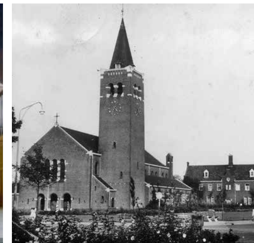
Heilig Hartplein gezien vanaf de Gastelseweg, c. 1960