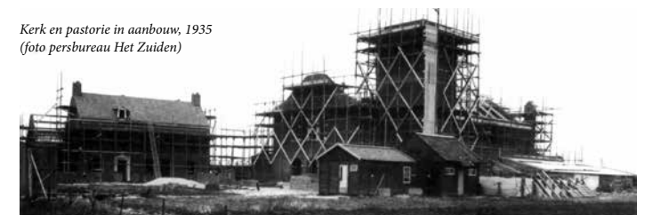
Kerk en pastorie in aanbouw, 1935