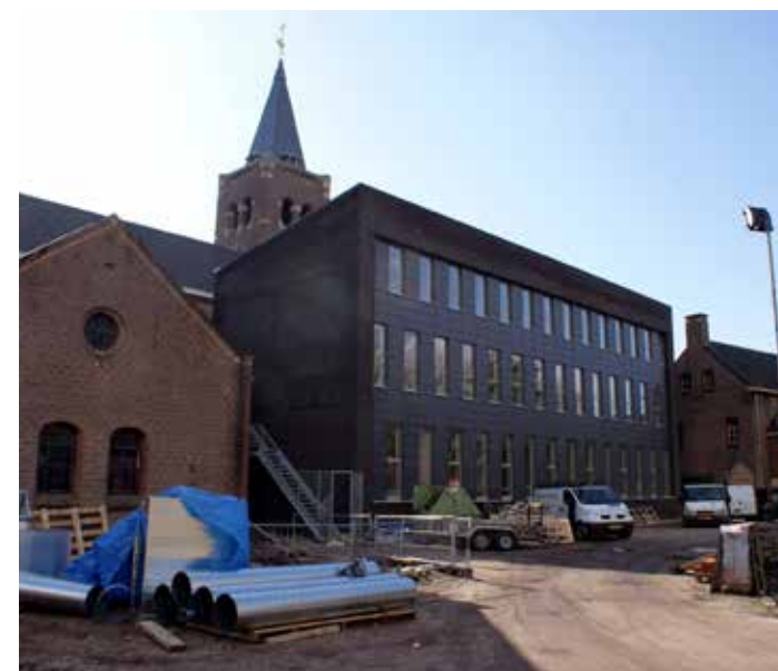
Gezondheidscentrum in aanbouw, 2010