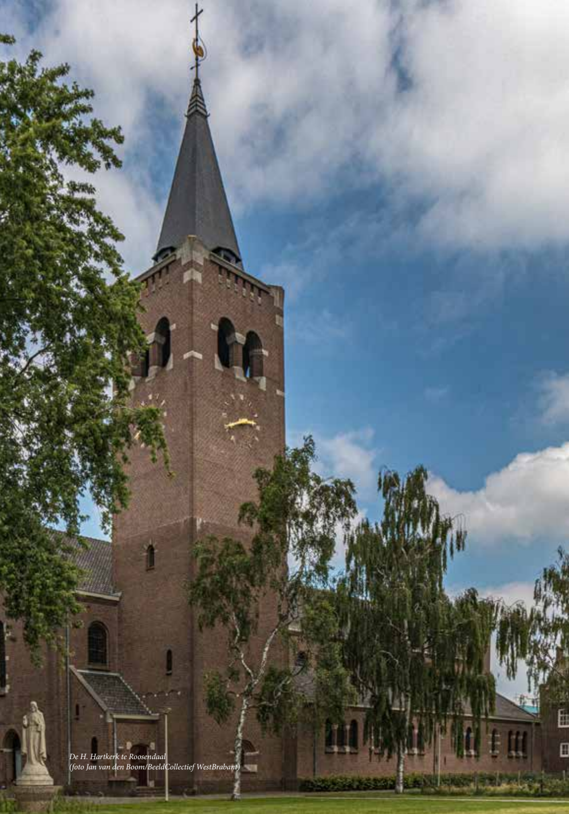
De H. Hartkerk te Roosendaal