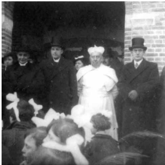
Ingebruikname kerk, 1936