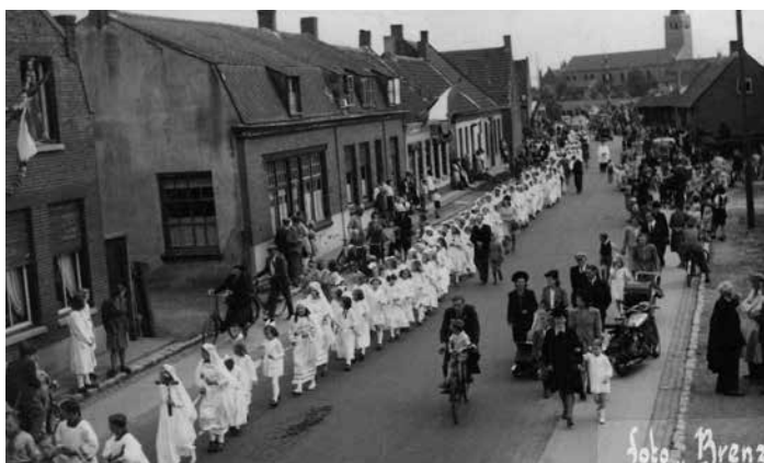
Processie op de Gastelseweg, 1939