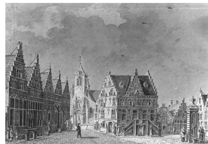
Het Raadhuis van Roosendaal, pentekening Verrijck, 1778.

Dit eerste Raadhuis heeft geen lang leven gekend vanwege de Tachtigjarige Oorlog. De watergeuzen hebben op 31 mei 1572 de kerk, het Raadhuis en 105 huizen aan en rondom de Markt in brand gestoken.