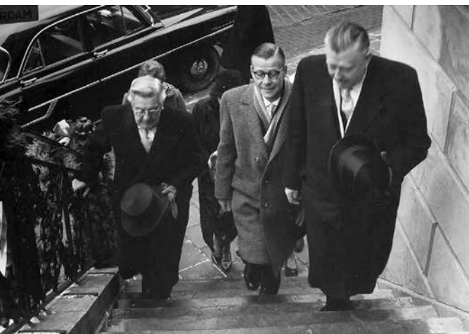
Inhuldiging burgemeester J. Godwaldt, 16 januari 1960