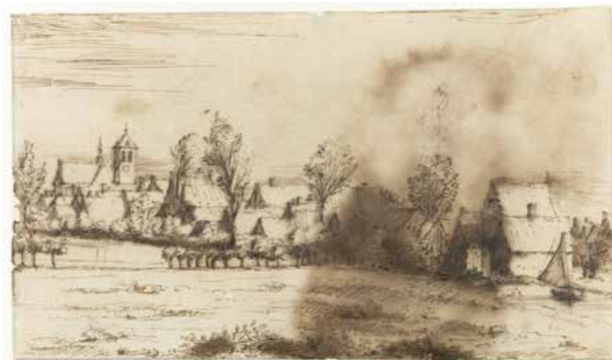
Pentekening C. Huijgens jr., 12 april 1676 (Rijksmuseum)