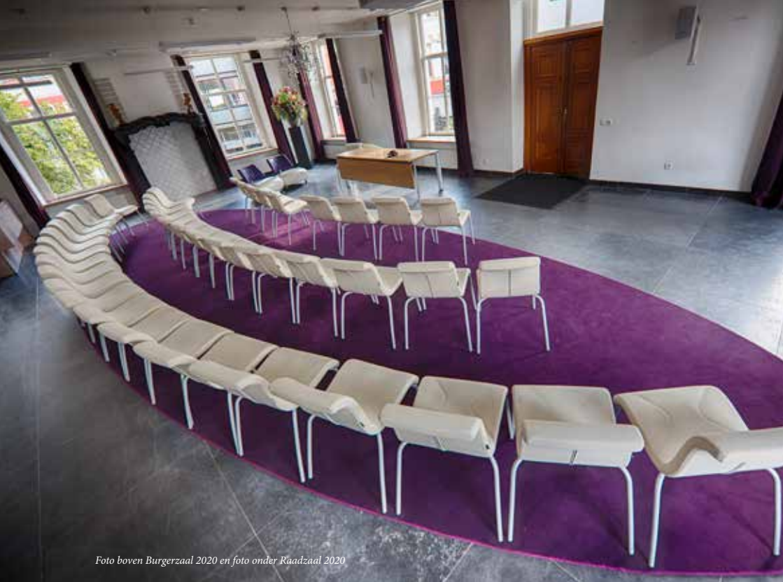
Foto boven Burgerzaal 2020 en foto onder Raadzaal 2020