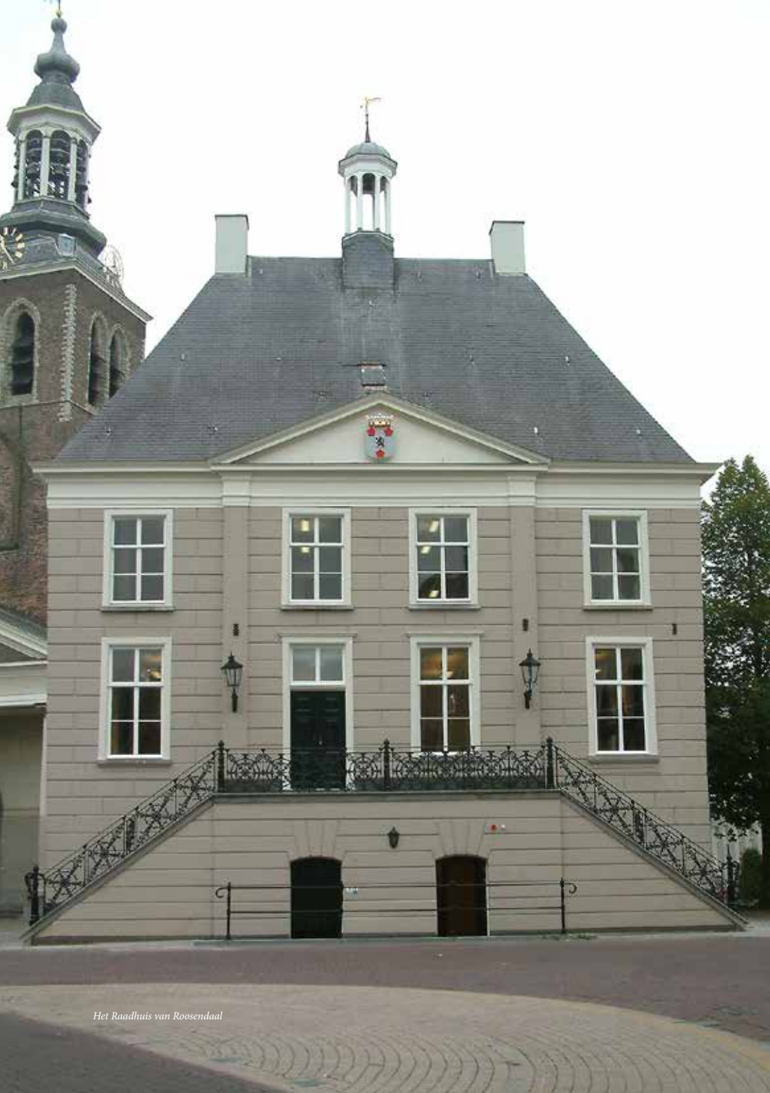
Het Raadhuis van Roosendaal

Het Raadhuis van Roosendaal heeft een bewogen geschiedenis achter de rug. In vijf eeuwen is het uitgebrand, weer opgebouwd en vaak verbouwd en veranderd. De laatste verbouwing dateert van 2005. Deze brochure geeft een beknopt historisch overzicht van de vaak turbulente geschiedenis van het Raadhuis. Dit overzicht is uiteraard niet volledig. Tijdens de afgelopen eeuwen is veel archiefmateriaal verloren gegaan. Ook speelt mee dat vóór 1851 de raadsvergaderingen niet openbaar waren. Het enige wat er van voor die tijd bewaard is gebleven, zijn de zogenaamde resoluties (de genomen besluiten). De redenen waarom de besluiten zijn genomen, worden er niet bij vermeld. Ze geven dus slechts een globaal idee van wat er met het gebouw is gebeurd.